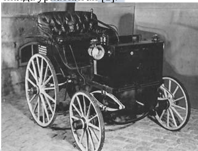
1-расм. "Панар-Левассор" автомобили

Бир вақтлар автомобиллар умуман сўндиргичларсиз ишлаган. Қисқа чиқариш қувурларидан тутун булутлари пайдо бўлиб, улар ўша пайтдаги двигателларнинг камтарона имкониятларига мутлақо мос келмайдиган даҳшатли шовқин чиқарар эдилар. Бироқ, атрофдаги пиёдаларнинг норозиликлари (ўша пайтда уларнинг сони кўпроқ эди), шунингдек, отларга тушадиган ваҳима (улар ўша пайтлар транспортида асосий тортиш кучи бўлган) шовқинни камайтириш қурилмаларининг зарурлигига олиб келди. Биринчи сўндиргич "Панар-Левассор" автомобилига 1894 йилда ўрнатилган [1].