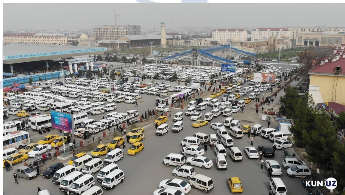
2- rasm. Yo'nalishdagi taksida qo'llanilayotgan «Damas» avtomobillari

Tahlillarga ko'ra, 2023 yil davomida "Damas" ishtirokida 228 ta (umumiy yo'l-transport hodisasining 30 foizi) yo'l-transport hodisalari sodir bo'lgan bo'lsa, shundan 50 foizi yoki 113 tasi piyoda va velosipedchini urib