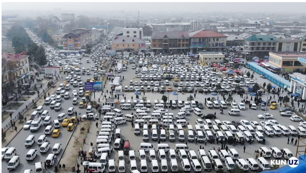
1- rasm. Yo'nalishdagi taksida qo'llanilayotgan «Damas» avtomobillari

Xozirgi kunda viloyat hududida 320 mingdan ortiq transport vositalari mavjud bo'lsa, shundan 24 foizi ya'ni 80 mingtasini "Damas" rusumli transport vositalari tashkil etadi hamda viloyatda yo'lovchi tashish faoliyatida keng foydalaniladigan asosiy transport vositalaridan biri hisoblanadi [4].